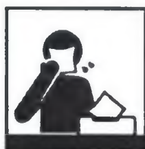
Пользуйтесь одноразовой бумажной салфеткой при чихании, кашле, насморке

Соблюдение следующих гигиенических правил позволит существенно снизить риск заражения или дальнейшего распространения гриппа, коронавирусной инфекции и других ОРВИ.