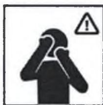
Не прикасайтесь к лицу немакияж руками