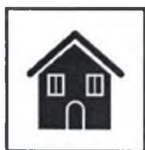
Оставайтесь дома в период массовых заболеваний