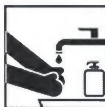
Чаше мойте руки