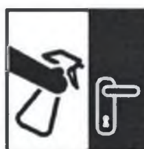
Влажная уборка дома ежедневно