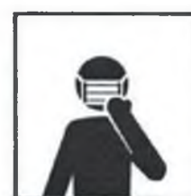
Пользуйтесь одноразовой маской